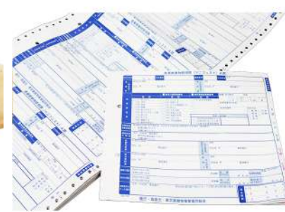
マニフェスト伝票 (産業廃棄物管理票)